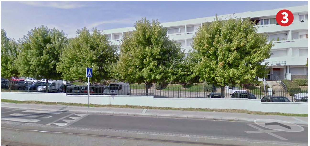
RESIDENCE FACE AU FONCIER