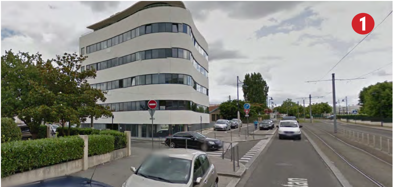
RUE CAMILLE PELLETAN