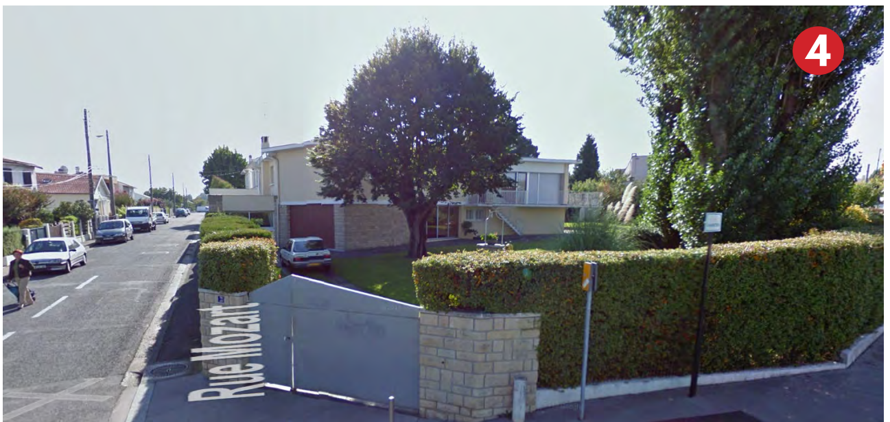
PAVILLON A CÔTÉ DU FONCIER