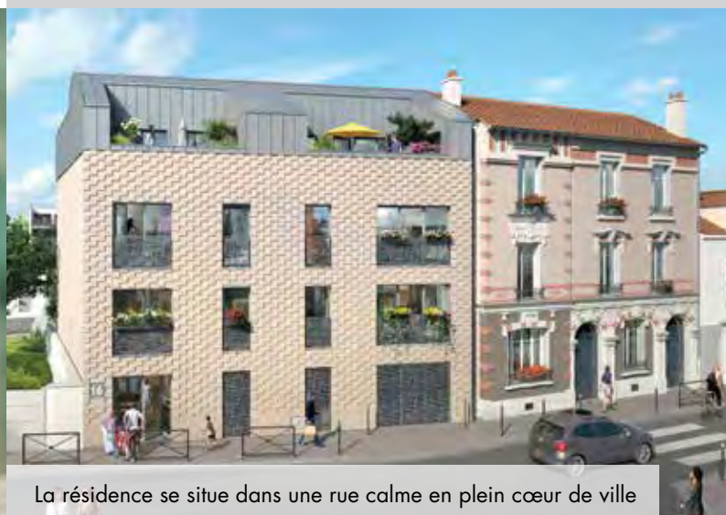
La résidence se situe dans une rue calme en plein cœur de ville