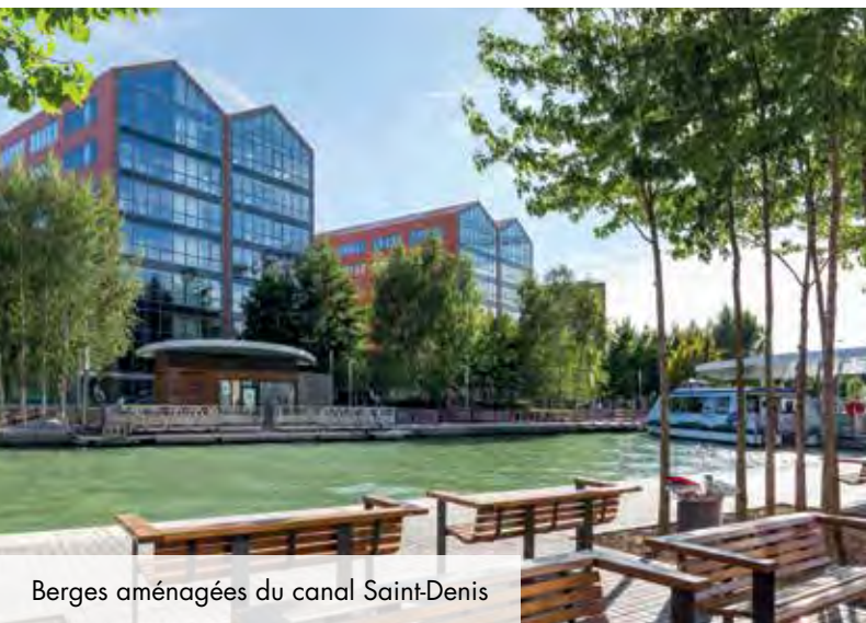
Berges aménagées du canal Saint-Denis

Riche d'histoire et pleine d'avenir, Aubervilliers se transforme de jour en jour. Son cadre de vie et sa proximité exceptionnelle avec Paris attirent une population jeune et dynamique. La densité de son tissu économique et la diversité de son offre culturelle et sportive font d'Aubervilliers une ville où il fait bon vivre et travailler.