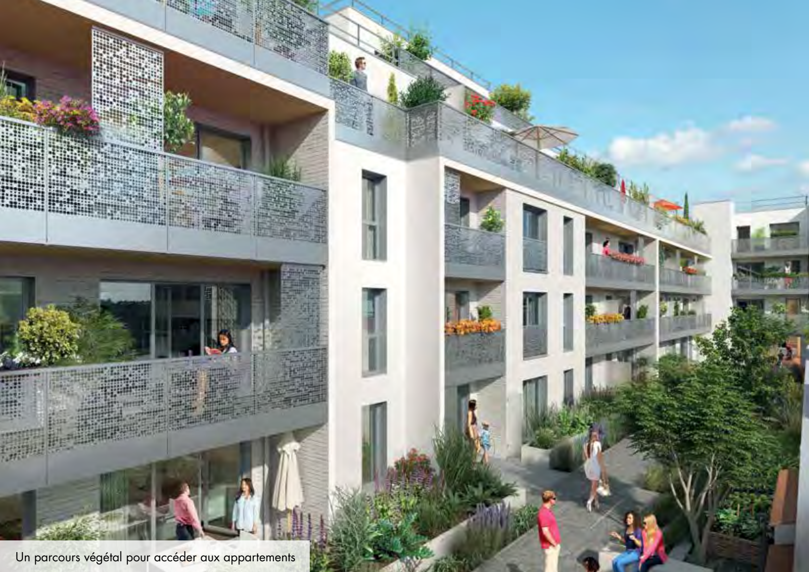
Un parcours végétal pour accéder aux appartements