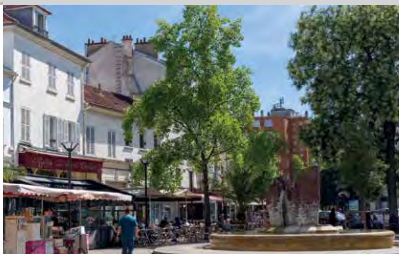
Place de la Mairie et parvis de l'église Notre-Dame-des-Vertus