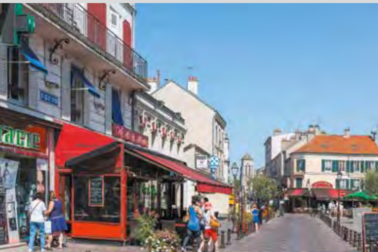
La place Henri Dunant et les rues piétonnes du centre-ville