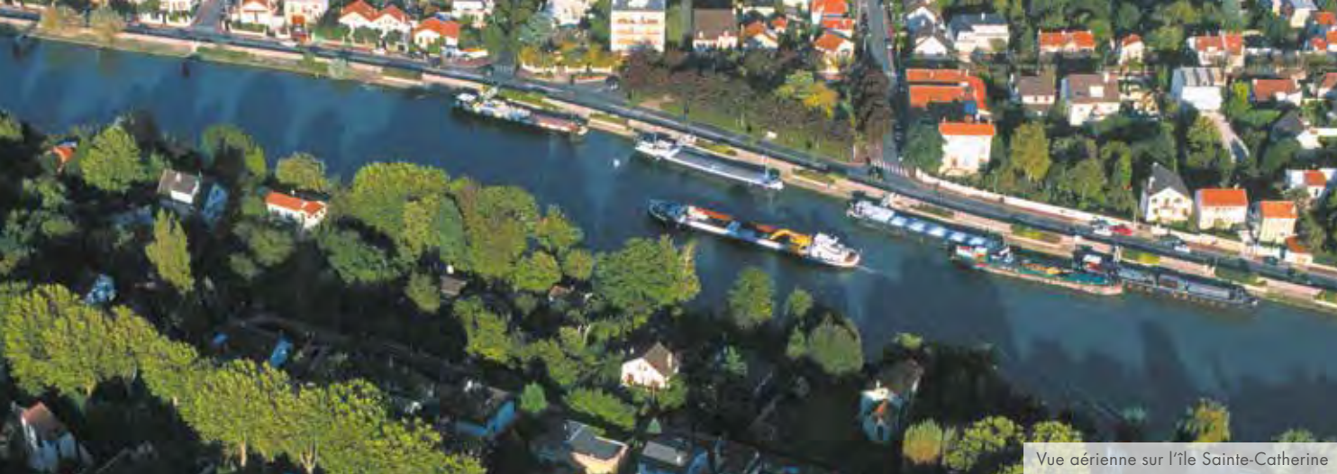
Vue aérienne sur l'île Sainte-Catherine