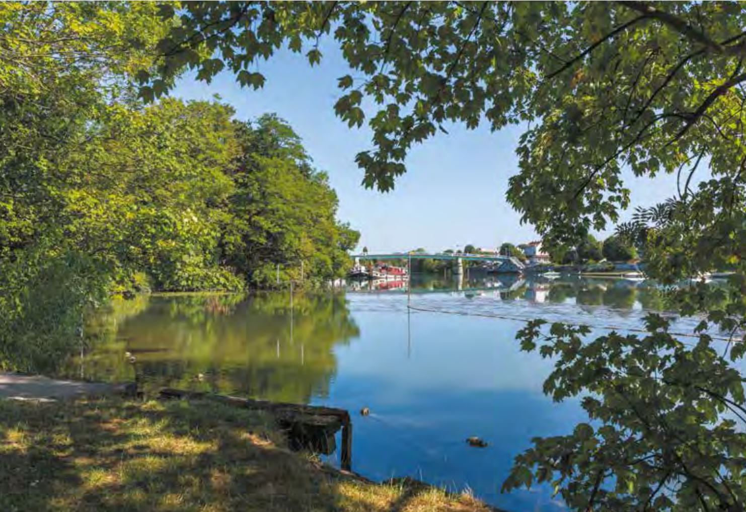
Les bords de Marne, à deux minutes à pied de la résidence