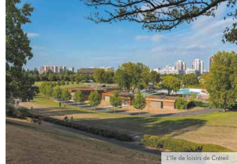
L'île de loisirs de Créteil

Les promeneurs et sportifs apprécient la variété de ses équipements et ses espaces verts tandis que les familles y trouvent de nombreux établissements scolaires et un choix d'activités pour s'épanouir. Dans cette ville authentique et dynamique, choisissez un quartier d'exception : Créteil Village, le centre historique aux nombreux commerces, bordé par la Marne.