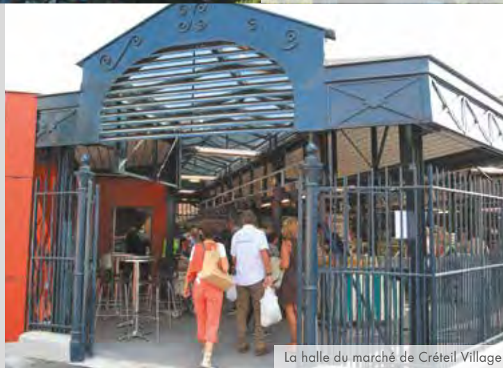
La halle du marché de Créteil Village