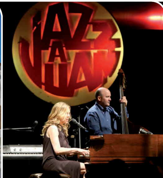
Festival Jazz à Juan