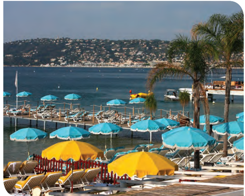
Plage de Juan-les-Pins

Une vie agréable vous attend à Villa Galice, en toute quiétude.