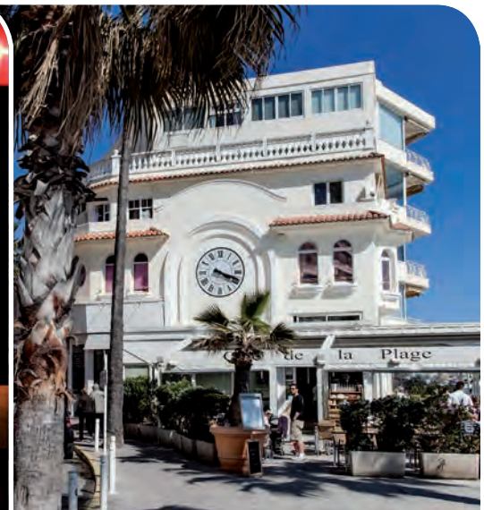
Boulevard Edouard Baudoin