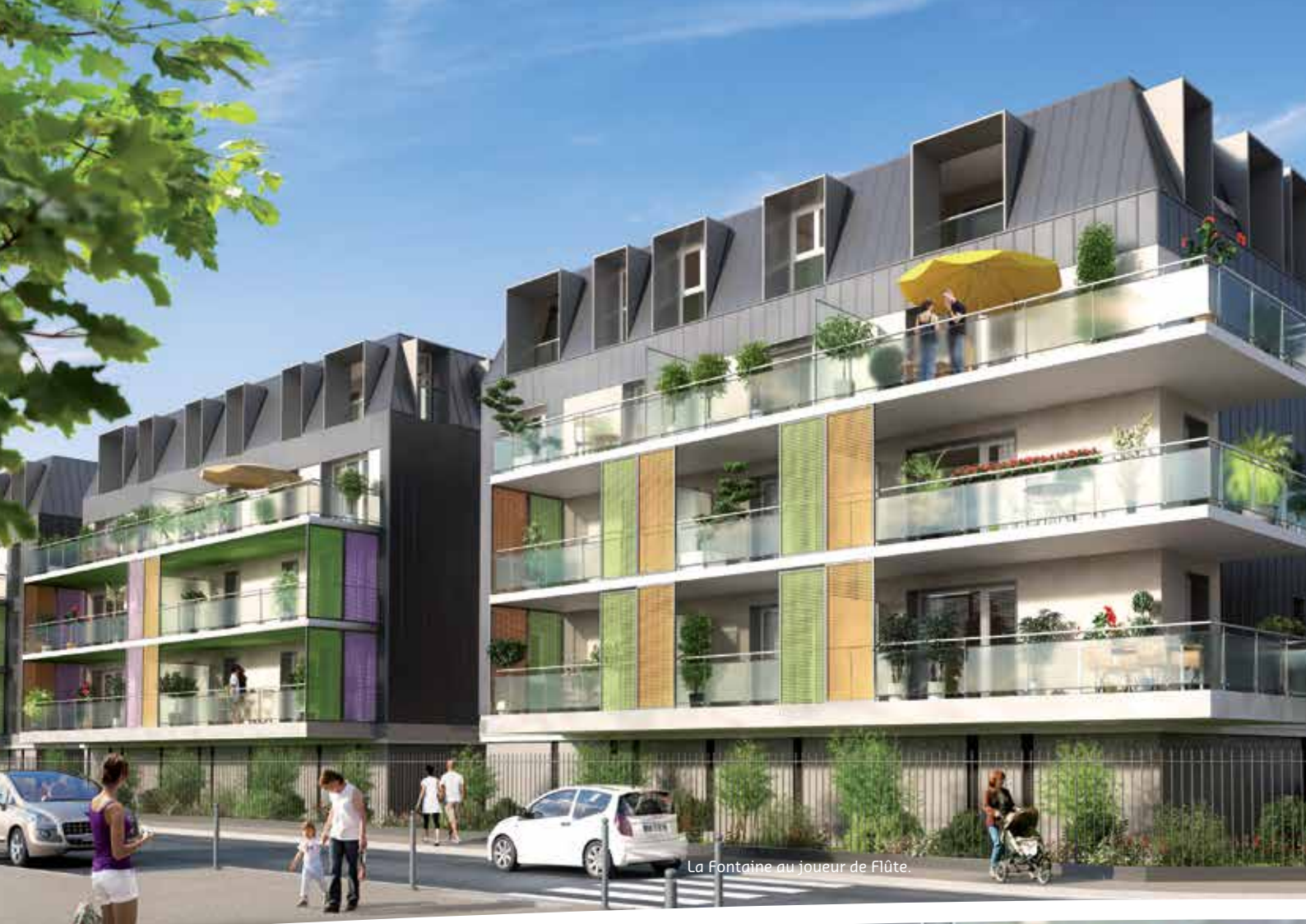
La Fontaine au joueur de Flûte.