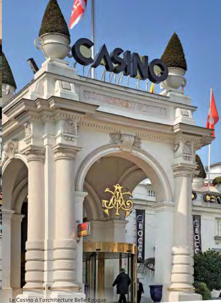
Le Casino à l'architecture Belle Époque.