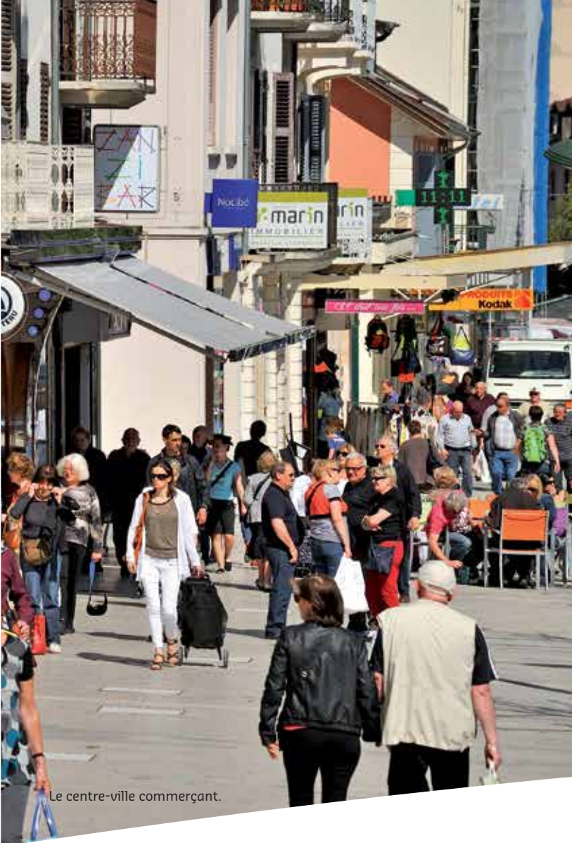
Le centre-ville commerçant.